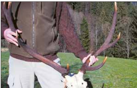
Plačila za trofeje v večini evropskih držav dobijo tudi lastniki zemljišč.

Po podatkih, pridobljenih na spletni strani LZS, so znašali prihodki od vsega prodanega mesa uplenjene divjadi lovskih družin v letu 2000 okoli 2,5 milijona evrov, od česar zavzemajo prihodki od lovskega turizma okoli 700.000 evrov, kar je povprečno okoli