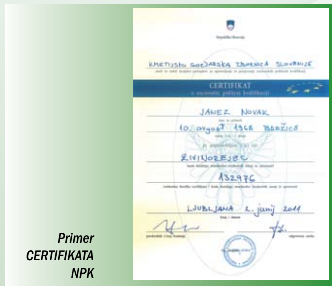
Primer CERTIFIKATA NPK

Kdo izvaja postopke preverjanja in potrjevanja za pridobitev NPK? Preverjanje in potrjevanje znanj in spretnosti za pridobitev NPK izvajajo izvajalci postopkov za ugotavljanje in potrjevanje poklicnih kvalifikacij, ki izpolnjujejo materialne in kadrovske pogoje določene s katalogom standardov strokovnih znanj in spretnosti. Izvajalci so vpisani v register izvajalcev pri Državnem izpitnem centru.