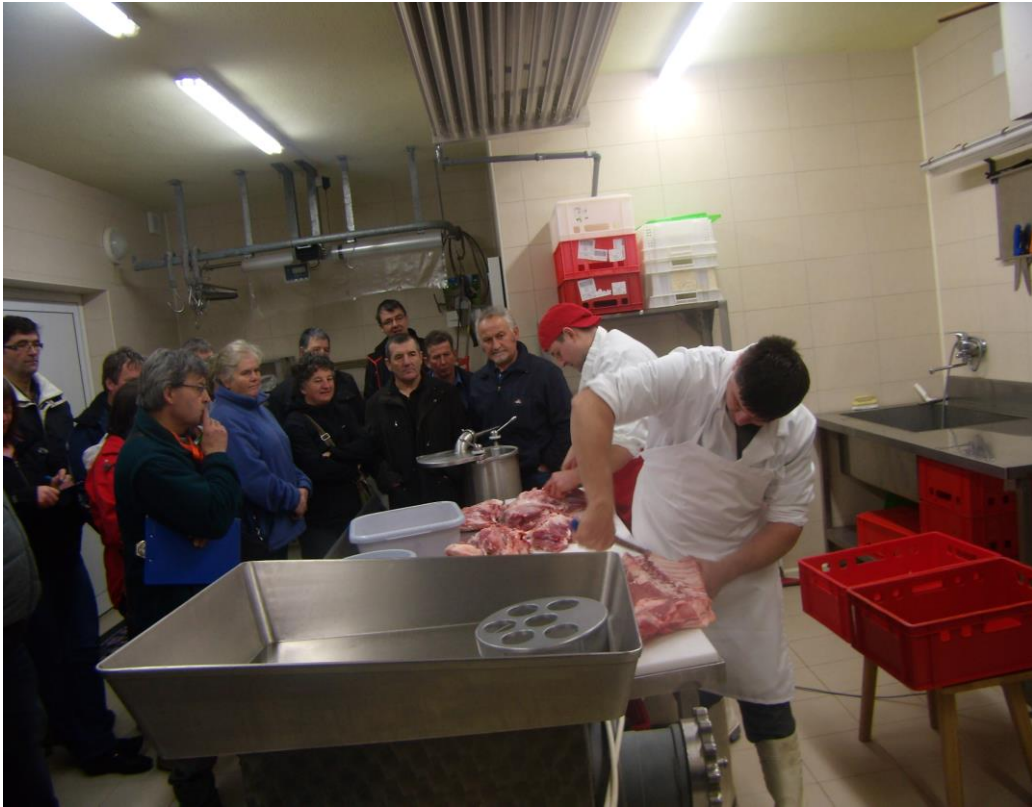
Slika 4: Tečaj izdelave klobas in salam brez umetnih dodatkov