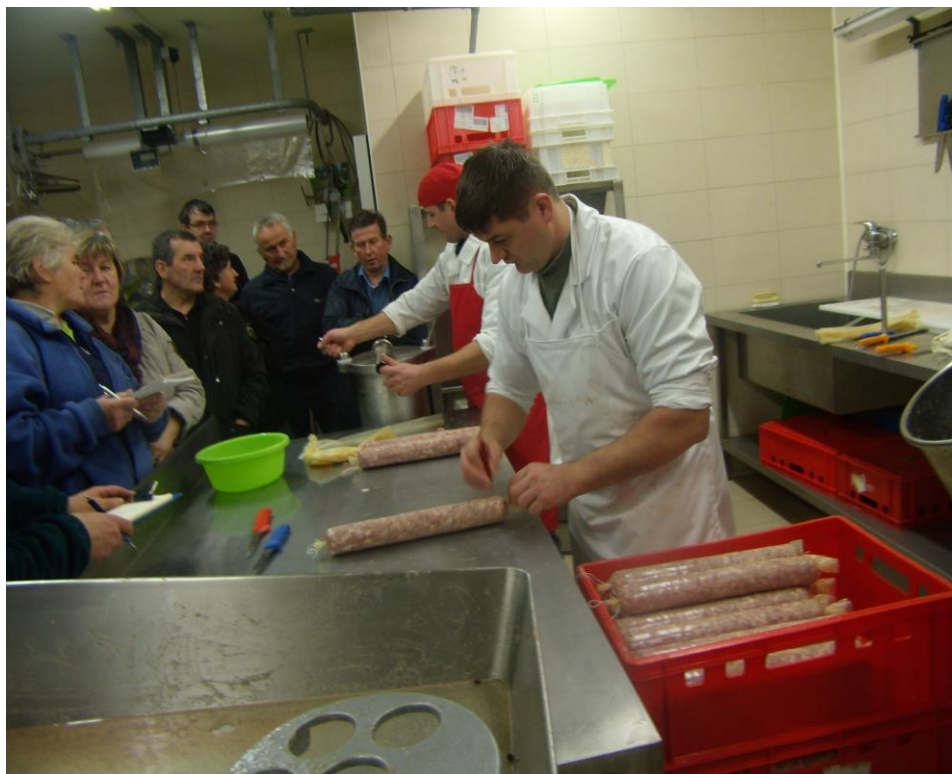
Slika 5 in 6: Tečaj Izdelave klobas in salam brez umetnih dodatkov

Pripravila: Vanja Bajd Freljih, koordinatorka za kmečko družino in dopolnilne dejavnosti