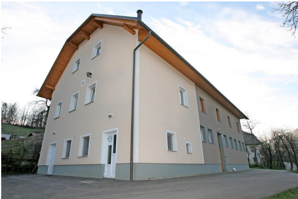
Slika 1: Objekt za predelavo mesa

Z investicijo so zaključili v letu 2014. Na kmetiji danes ponujajo paleto domačih mesnih izdelkov izdelanih po domačih recepturah brez umetnih dodatkov in so narejeni v higiensko urejenih prostorih. Poleg izdelkov ponujajo tudi usluge predelave mesa, kot sta razsek in sušenje izdelkov. Investicija za kmetijo pomeni izboljšanje dohodkovnega položaja, možnost vzpostavitve novega delovnega mesta in s tem dolgoročno tudi ohranitev kmetije. Je pa tudi velika pridobitev za sam kraj, kjer tovrstne ponudbe še manjka. Poleg prostorov za dopolnilno dejavnost je investitor z lastnimi sredstvi naredil tudi hlev za 20 glav živine (prizidek k objektu za predelavo mesa).