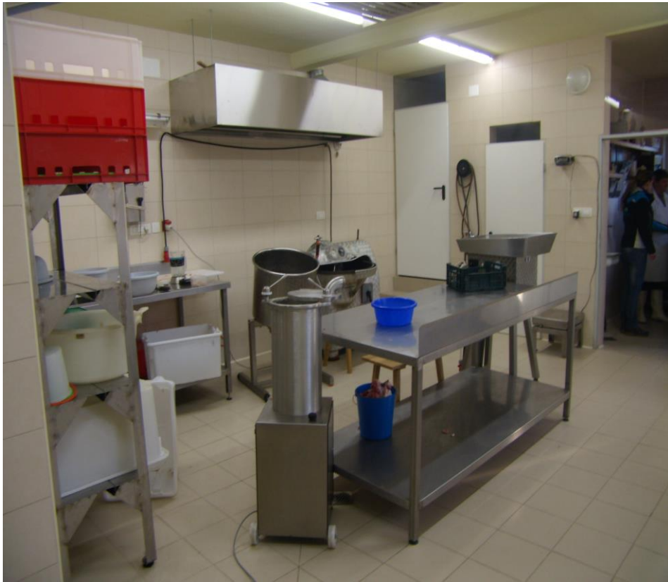
Slika 2: Prostor za razsek mesa, pripravo in pakiranje izdelkov